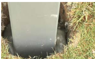
PFAHL FESTHALTEN (3 Min.) bis zur vollständigen Ausdehnung des Kunstharzes.