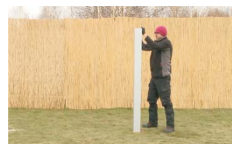
VOLLE BELASTBARKEIT nach 90 Min.