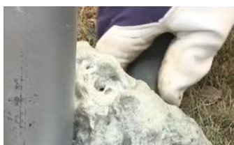
KUNSTHARZ ENTFERNEN (nach 10 Min.) mit einem Messer, Spaten usw.