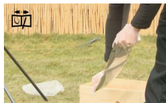
TRENNBÜGEL ENTFERNEN durch Auseinanderziehen der Beutelenden.