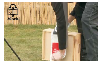
MISCHEN (20 SEK.) durch wiederholtes Vor- und Zurückziehen des Beutels um einen stumpfen Gegenstand.