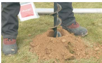
BOHREN Lochtiefe und Lochdurchmesser gemäss Tabelle.