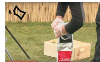
OFFNEN an der markierten Stelle.