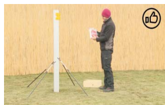
PFAHL EINSETZEN Schutzhandschuhe anziehen.