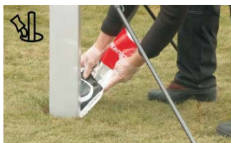
EINGIESSEN und regelmässig um den Pfahl verteilen.