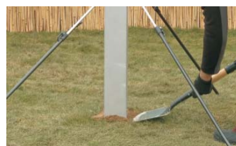
KUNSTHARZ ZUDECKEN um vor der direkten Sonnenei- strahlung zu schützen.