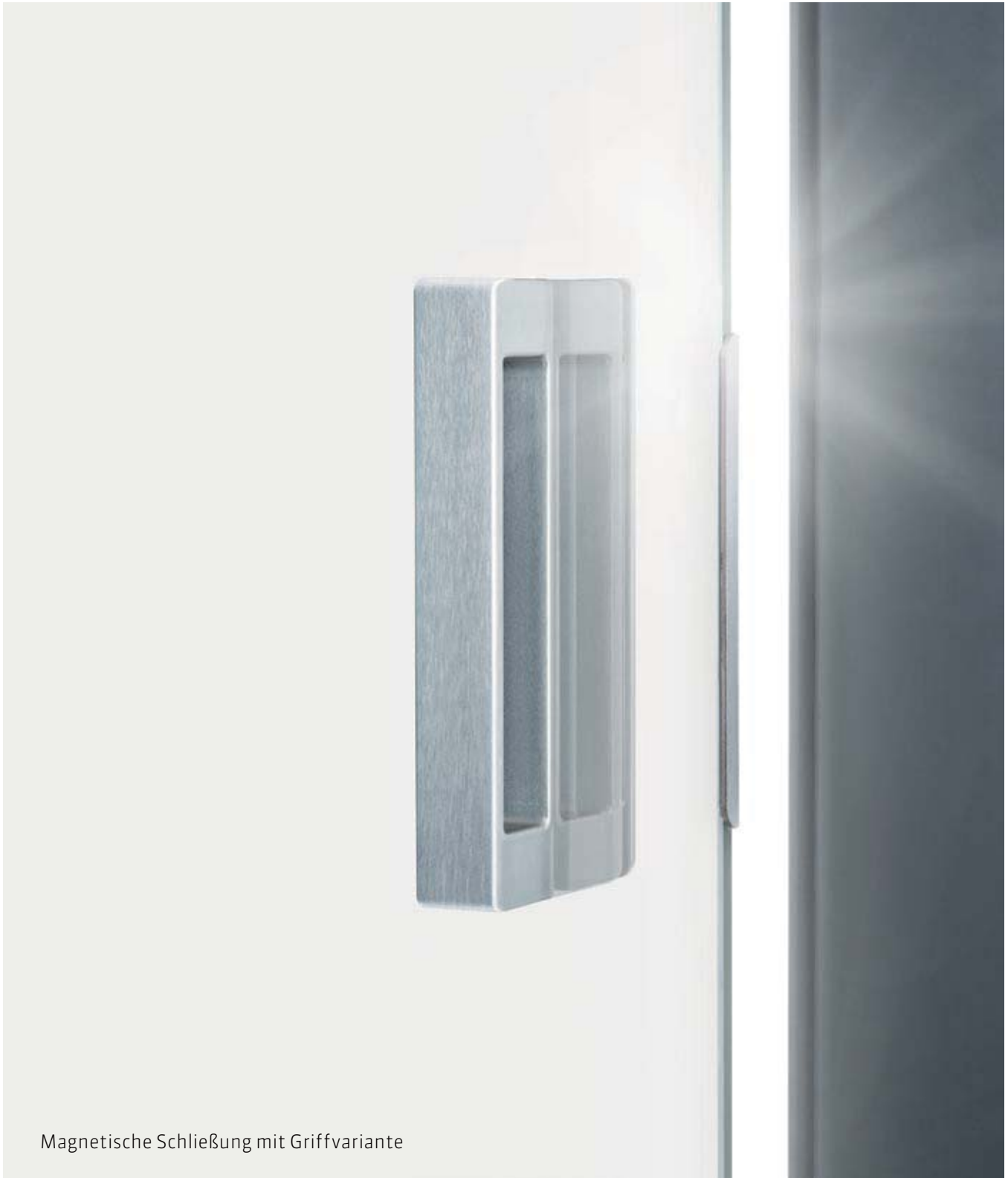
Magnetische Schließung mit Griffvariante