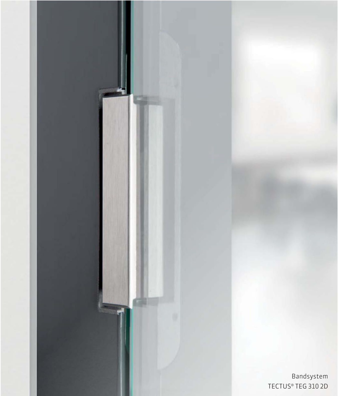
Bandsystem TECTUS® TEG 310 2D