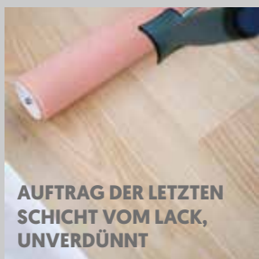
AUFTRAG DER LETZTEN SCHICHT VOM LACK, UNVERDÜNNT