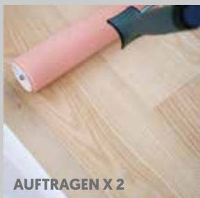
AUFTRAGEN X 2

Wöchentliche Reinigung: Master Cleaner, #684525 Halbjährliche Pflege: Master Care, #684125