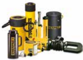
Zylinder & Hubsysteme