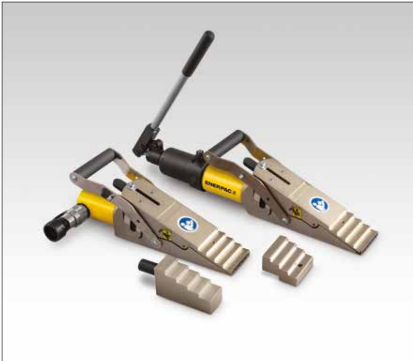
▼ Abbildung: LWC16, LW16 mit SB2 und optionalem LWB1