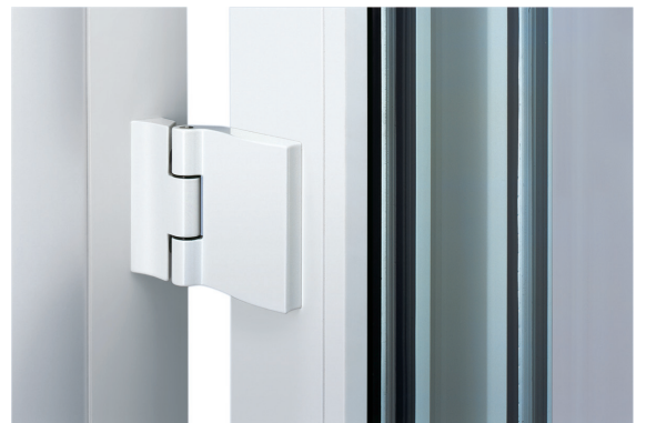
Rahmenband verstellbar und pulverbeschichtet