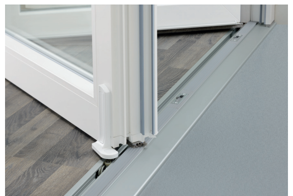
Komfort-Bodenschwelle barrierefrei, hohe Wärmedämmung