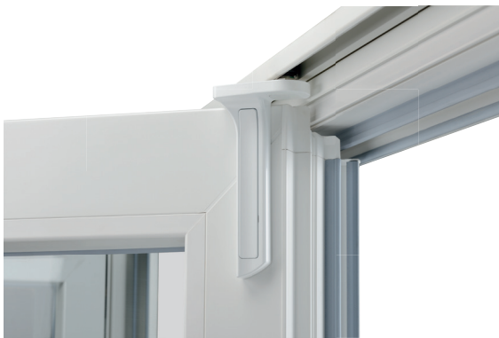
Starke Aufhängung ermöglicht hohe und schwere Flügel