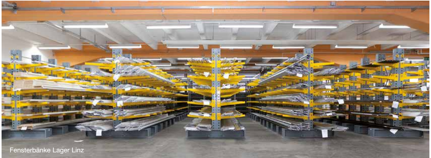
Fensterbänke Lager Linz

Alle lagernden Außenfensterbänke Standard 25 und Soft 40 mit Zubehör werden auch als Schnittware innerhalb von 24-48 Stunden geliefert.