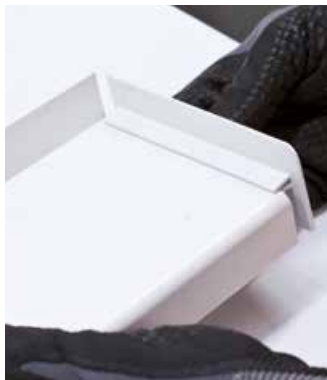
Montage der seitlichen Alu-Abschlüsse