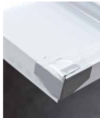
Dichtungsformteil Butylpflaster für eine saubere Abdichtung