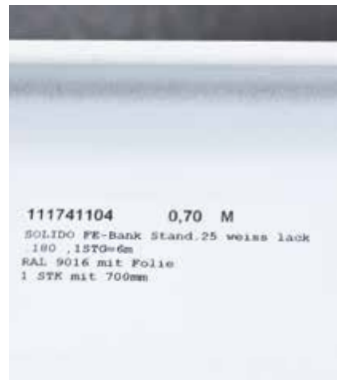
Etikettierung auf der Fensterbank mit einem individuellen Text