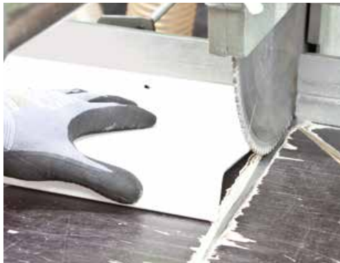
Längsschnitt auf das gewünschte Maß

Im SCH-Anarbeitungszentrum sind viele Dienstleistungen möglich: