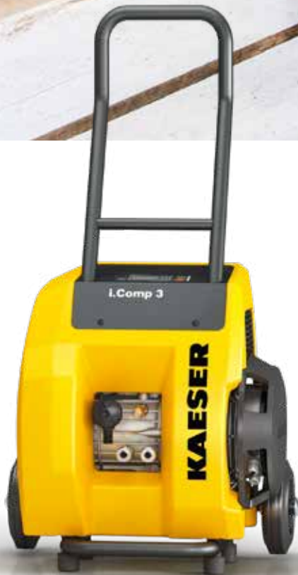
Abb.: i.Comp 3

Bestens geeignet um längere Wege zu überbrücken