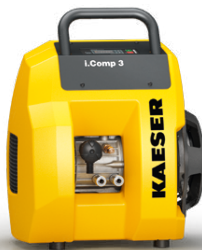
Abb.: i.Comp 3

Kann problemlos überall mitgenommen werden