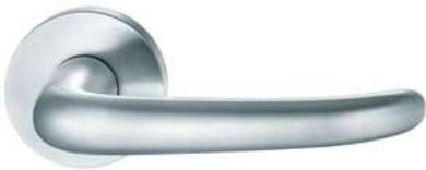
6204 Fein matt gebürstet