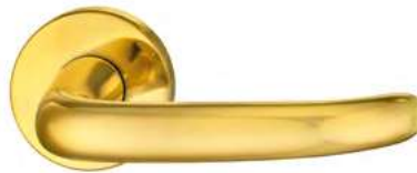
4305 Poliert gewachst