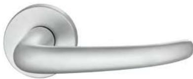
0105 Poliert naturfarbig