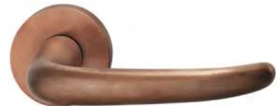
7615 Hell patiniert gewachst