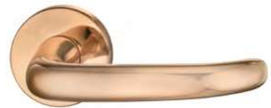
7305 Poliert gewachst