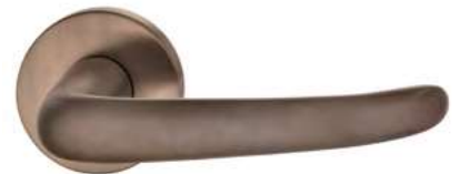
7625 Dunkel patiniert gewachst