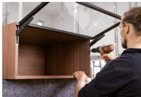
Regolazione della base forza dal lato anteriore