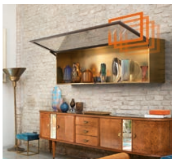
Chiusura dolce e silenziosa, apertura opzionale con TIP-ON