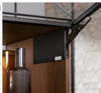
Parzialmente integrato con placchette di copertura