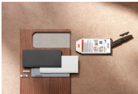
Regolazione della base forza dal lato anteriore