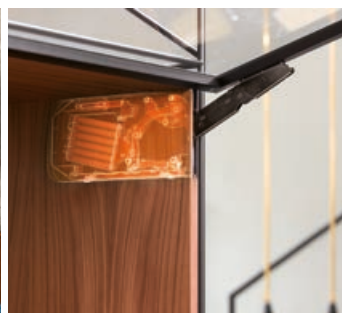
Tecnica robusta per lunga durata e comfort d'uso facile