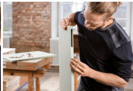
Pannelli grezzi in MDF pre-fresati