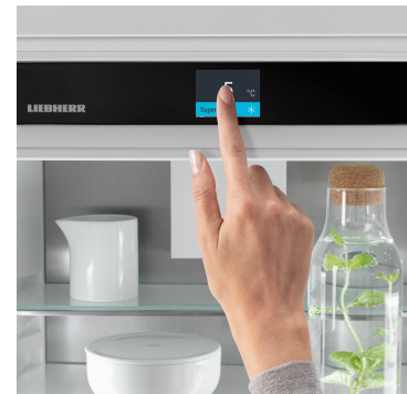
Touch & Swipe-Display

Freuen Sie sich über einen optimal ausgeleuchteten Innenraum: Die LightTower rücken Lebensmittel ins beste Licht und sie sind so positioniert, dass Ihr befüllter Kühlschrank stets großflächig ausgeleuchtet wird. Da die LightTower flächenbündig in die Seitenwände integriert sind, bleibt zudem mehr Platz für Ihre Lebensmittel.