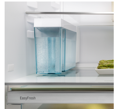
IceMaker mit Wassertank

Echt berührend: Durch das Touch-Display bedienen Sie Ihren Liebherr einfach und intuitiv. Auf dem Display sind alle Funktionen übersichtlich angeordnet. Mit einem leichten Fingertipp wählen Sie zum Beispiel mühelos die Funktionen aus oder prüfen die aktuelle Temperatur Ihres Kühlgeräts.