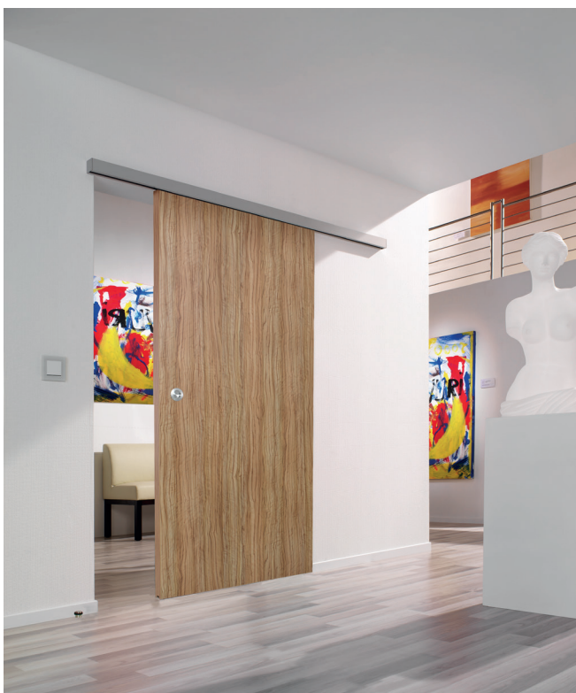
HELM GT-L 50 s pokrivno letvijo, srebrno