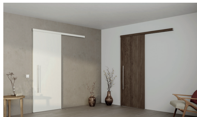
HELM GT-L 50 z Inlay pokrivno letvijo