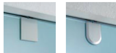
Placchetta di copertura tonda e angolare.

HAWA-Junior GP: per spessore vetro 8 – 12,7 mm